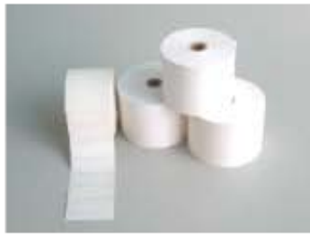
W58Xφ70 5巻梱包 TP58735