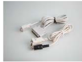
新光電子用 MC-RSS A&D用 MC-RSA